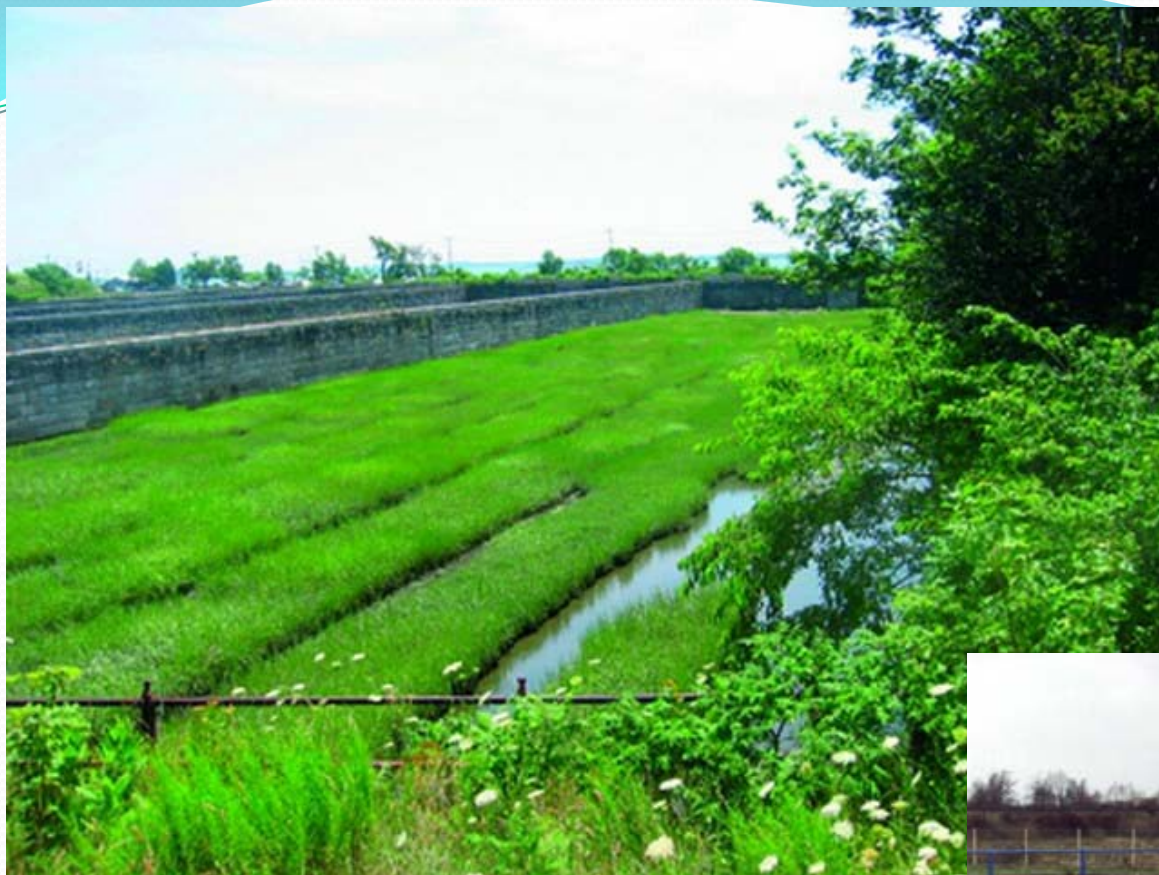
Takhle vypadá kořenová čistička