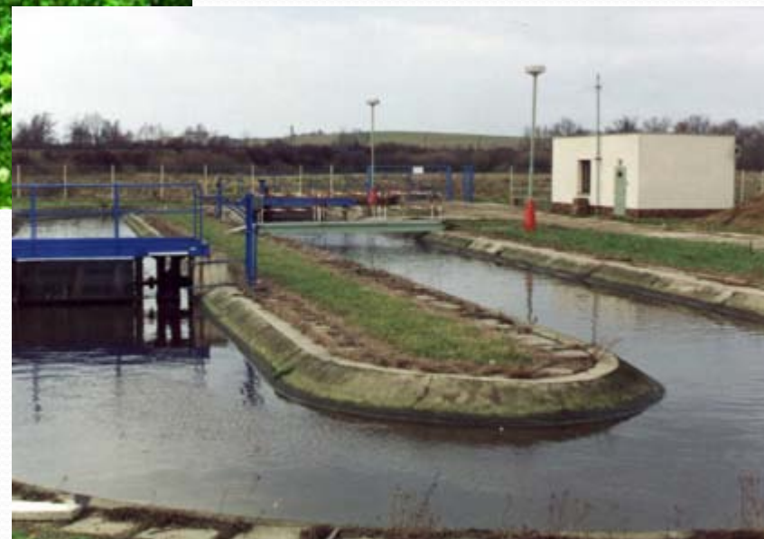
Čistička odpadních vod